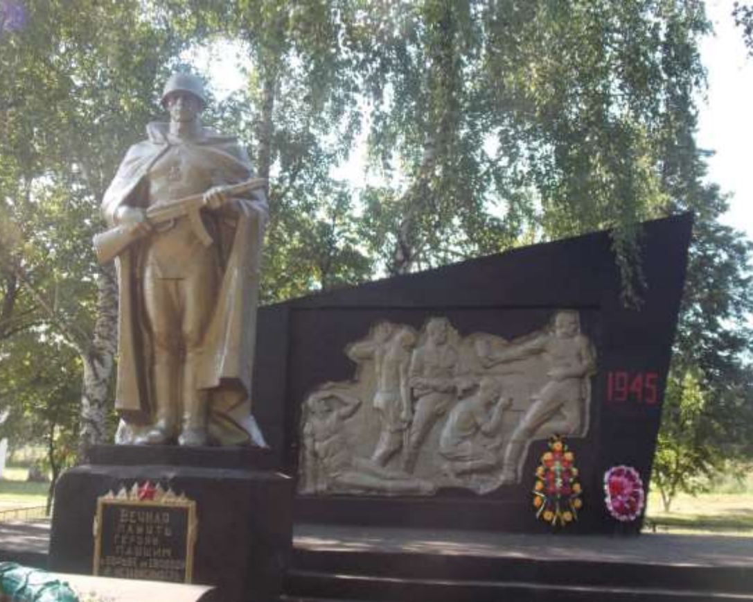
Памятник погибшим воинам

Памятный знак в урочище "Послово" погибшим на месте расстрела