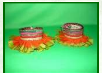
Колечки из меди.

Серьги – выполнялись из кованого железа, с цветными вставками и украшены бусинами из поделочного камня или речного жемчуга.